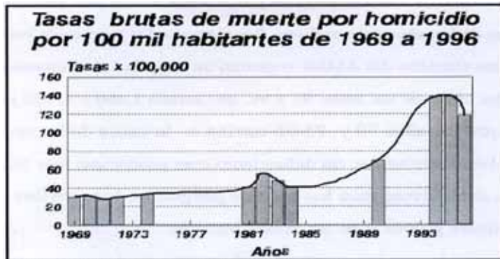
Gráfico1: Tasas de homicidios en el período 1969-1996

Fuente: Elaboración propia según cifras de la OPS y la FGR.