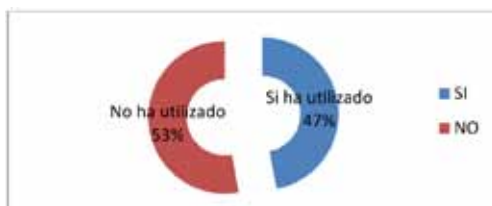
Gráfico 1: Funcionarios que han o no han utilizado beneficios de su C.C.A.F 4

En el presente gráfico se aprecia lo que los encuestados respondieron a la pregunta ¿Han utilizado alguna vez algún beneficio entregado por su Caja de Compensación? Y podemos ver claramente que es muy alto el porcentaje de personas que señala no haberlos utilizado, un 53%.